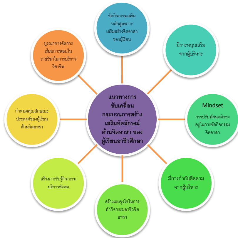
ภาพที่ 1 แนวทางการขับเคลื่อนกระบวนการสร้างเสริมอัตลักษณ์ด้านจิตอาสาของผู้เรียนอาชีวศึกษา